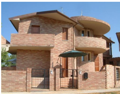
Un testo immaginato come una costruzione

Proviamo ad immaginare il testo come una costruzione costituita da mattoni : le parole specifiche di una materia , come cellula, latitudine, trapezio .