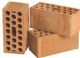
Le parole mattone : le parole specifiche di una materia