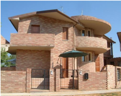
Un testo immaginato come una costruzione

Proviamo ad immaginare il testo come una costruzione costituita da mattoni : le parole specifiche di una materia , come cellula , latitudine , trapezio .